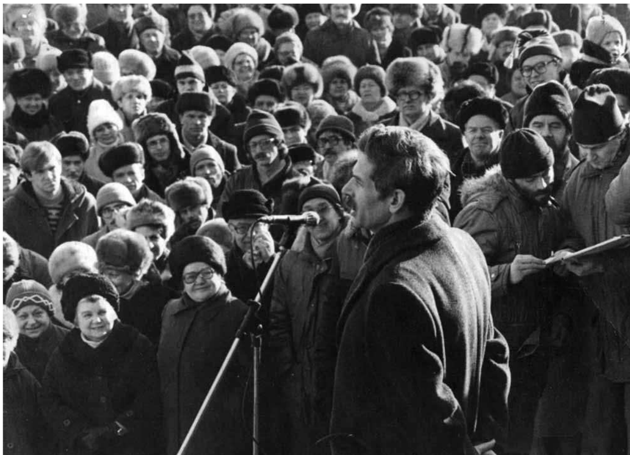
«Ижорец» 4 марта 1989 года